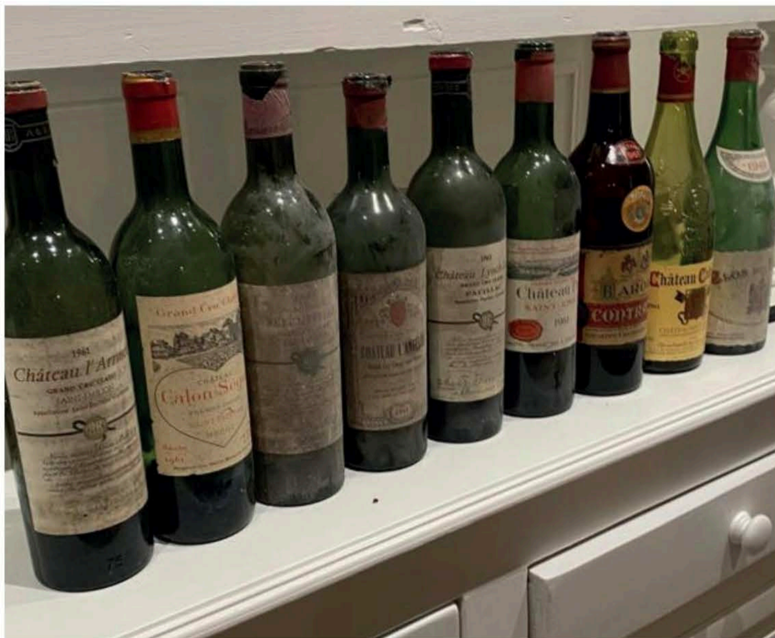
De 9 wijnen, waarvan 6 uit Bordeaux, 2 uit de Rhône en 1 uit Barolo